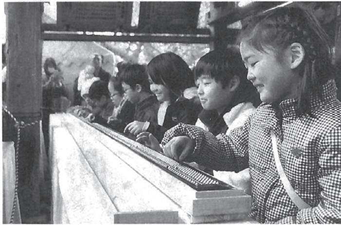
長そろばんではじき初めをする参加者 || 京都市上京区馬喰町の北野天満宮で