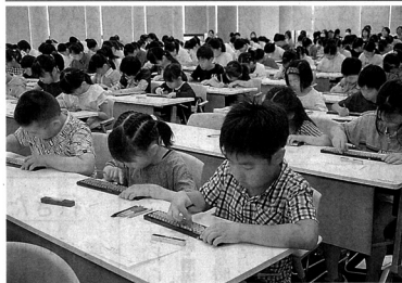
真剣な表情でそろばんをはきく子どもたち (京都市下京区・京都経済センター)

京都市内の子どもたちがそろばんの腕を競う「京都カップ珠算大会」が2日、京都市下京区の京都経済センターであった。小学1年から高校3年までの207人が真剣な表情で見取り算や暗算に挑んだ。 京都商工会議所と京都珠算振興会が2001年から主催し、今年も参加人数が最も多かった。5桁同士の掛け算や割り算、3分間で100問を解く暗算などがあり、参加者はそろばんを素早くはきき、答えを導き出した。