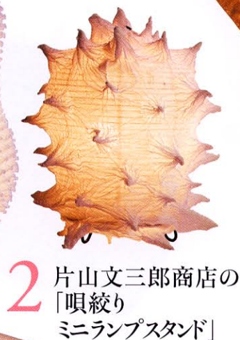
2 片山文三郎商店の「唄絞りミニランプスタンド」