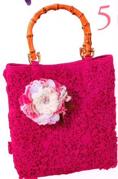
5 ヒロブルーロワさんの「レース編みバッグ&コサージュ」