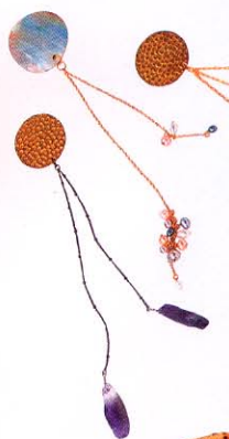
4 HAZKIの「パーティバッグ&帯飾り」