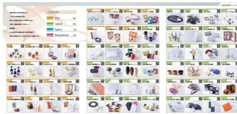
前回のリーフレット