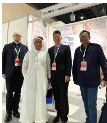
「Kyoto,Japan in Dubai 2024」コスメディ製薬ブースにて

初めての海外での大きな展示会でしたが、京都の企業であるコスメディ製薬の世界初※1のマイクロニードル化粧品について、来場者の皆さんから大きな関心と反響をいただき、また数多くの出展社の中から「創造的デザイン賞」に選んでいただいたことをとても光栄に感じています。