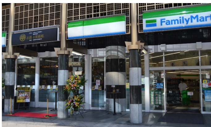
ファミリーマートのコラボ店舗（京都駅前店）

■ファミリーマートの一角にバー「お酒の美術館」がオープン！「コンビニバー®」形態で新たなシナジー効果を生み出す 昨年10月にオープンした「ファミリーマート」とのコラボ店舗「お酒の美術館 京都駅前店」が好評のため、この度、新たに「ファミリーマート」とのコラボ店舗として「お酒の美術館 本能寺店」「お酒の美術館 阪急西院駅前店」の2店舗をオープンいたします。身近なコンビニで気軽に、リーズナブルにお酒が飲める新感覚のバー「コンビニバー®」が注目されています。「お酒の美術館」では、新しい客層の取り込みや多くの方に広く認知してもらえるメリットがあり、「ファミリーマート」では、おつまみの売上がアップするなど、シナジー効果も生まれています。