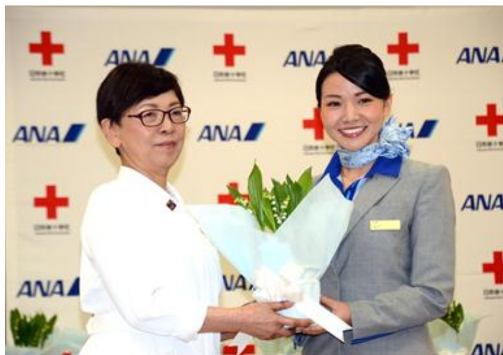
第 63 回式典(東京地区)

ANA グループでは、5月29日(水)、全国各地51カ所の赤十字病院と関連施設へすずらんの花と手書きのメッセージを添えたしおりをお届けいたします。