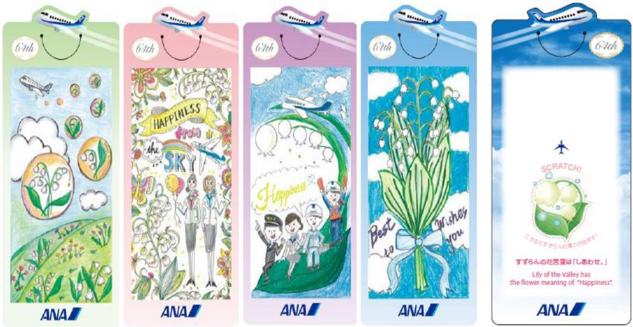
しおり(表): ANA グループ社員によるデザイン