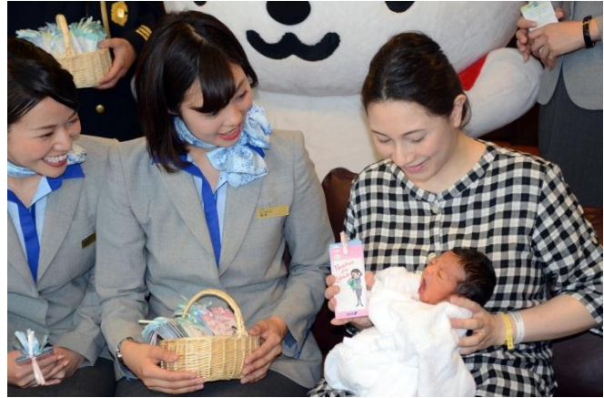
2018年(第63回)日本赤十字社医療センターにて