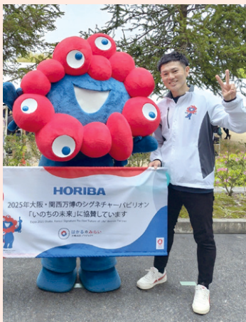
ミャクミャクと一緒に

博覧会協会では、国・自治体、警察、消防、さらに約200の民間企業から集まった約900名が働いており、はじめて万博の運営に携わる職員が大半を占めます。異なる文化や価値観を乗り越えて、「お客様に喜んでいただきたい」という共通の思いのもと、一丸となって取り組んでいます。出展者や協賛企業、受託業者等と共に、多くの人々が関わり、作り上げた建物、展示、イベント等を通して、お客様の驚きや笑顔を見ることが私たちの喜びです。ぜひ会場に足をお運びください。