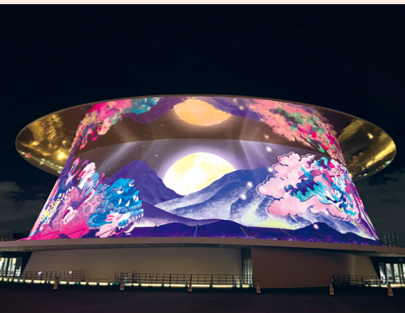
EXPOホール「シャインハット」のプロジェクションマッピング

夜になるとEXPOホール「シャインハット」ではプロジェクションマッピングが行われます。大屋根リングやパビリオンのライトアップ、水上ショー（毎日開催）や花火の打ち上げ（不定期）等もあります。夜の万博会場もぜひお楽しみください。