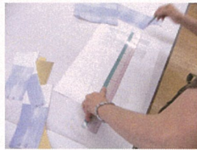
高い修正力。簡単な修正であれば、現場で対応。