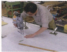
確かな技術を持つ職人による高精度の加工技術。