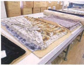
生地をリラックスさせるための一昼夜の放反。