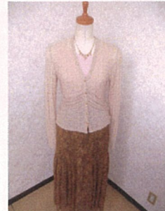
複雑な形であっても、高いサイズ精度を実現。