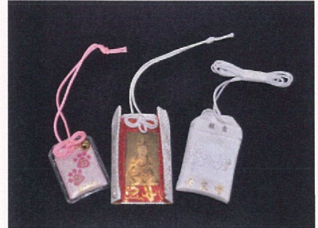
ユニークな御守の一部。左から、ペット用、扉が開き見えるタイプ、裏面ポケットに願意を入れて首から吊り下げるタイプ