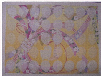
左：子供の写真が入った御守 右：成長を見守ってくれる家族や親戚の顔ぶれ、つながりがわかる見守り帖