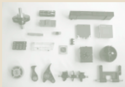
熱硬化性樹脂の精密インサート成形品