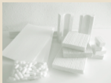
PEF (古紙系発泡体) 製品

社員一人ひとりのチャレンジ精神をどうやって高めていくかなど苦労した点多かったのですが、その反面、一つの目標を成し遂げたことによって、「私たちもやればできるんだ!」という自信やまとまりが社内に芽生え、新たな製品開発の意欲向上につながりました。また、社内の“3S活動”(整理・整頓・清掃)が活性化するなど、プラスαの効果もあったように思います。3S活動の目的は「決められたことを守ること」、そして「その風土を社内に定着させること」に尽きるのではないのでしょうか。さまざまな個性を持った企業と連携を進めていく中で、より強力な“絆”と“信頼関係”を構築しなければ!という社内認識が広がり、モノや場所だけでなく、情報、仕事のあり方、考え方すべてにおいて、3Sをベースとした活動を実践することができました。「第2創業・チャレンジ50」の取り組みを通して、私たち