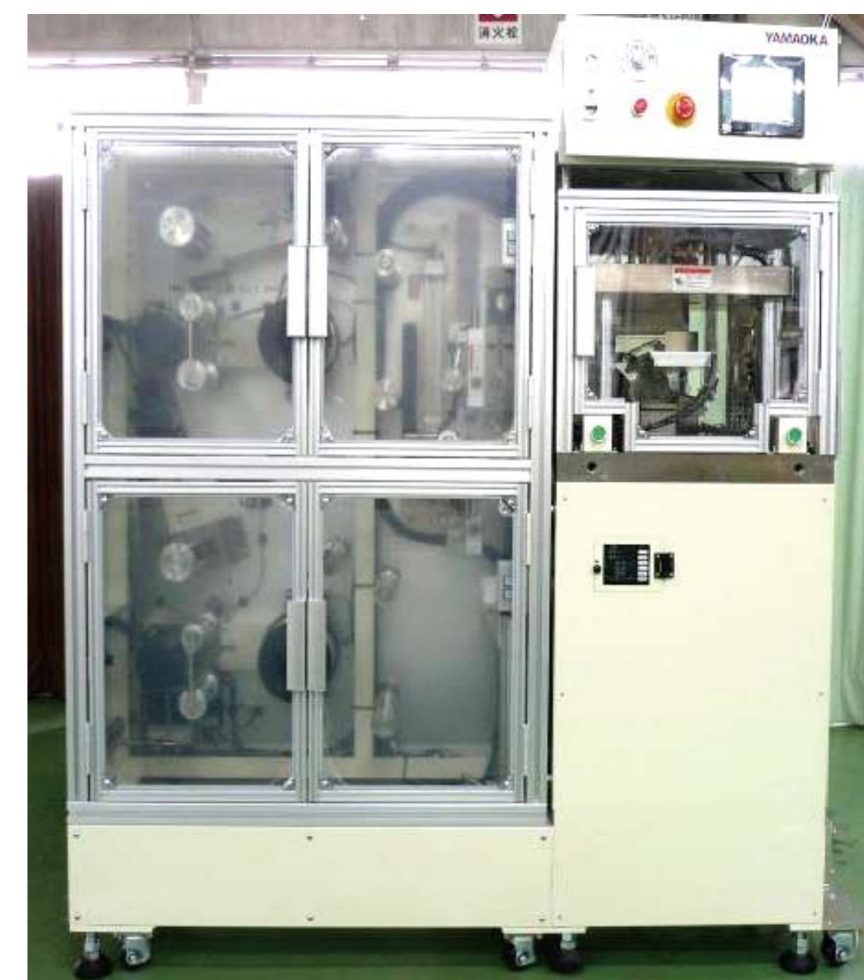
ブルーレイプレスシステム

1938年、京都市左京区でプレス部品の製造業者として創業。以来その技術を高め、労働環境の整備などと合わせ、中小企業長官賞、労働大臣賞、京都府中小企業モデル工場指定、京都府中小企業優秀技術賞など数多くの賞を受賞、また環境分野でも京都府より「エコ京都21」の認定を受ける。