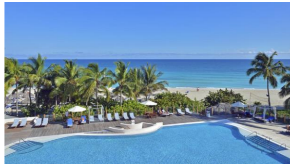
(バラデロ メリア ラス・アメリカス ホテル)

ハバナの東132km、大西洋に突き出た細長いヒカコス半島にあり、太陽と海と白砂と揃ったキューバ屈指の国際的なリゾート地です。1930年代デュポンをはじめ欧米の資産家達がこの地に競って別荘を建てたのが始まりで、現在もホテルやレストランとして利用されています。