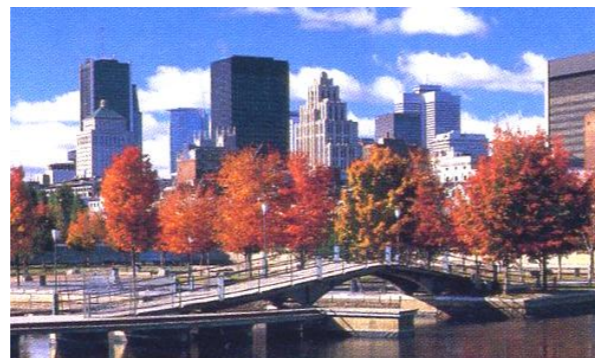
(秋のモントリオール)

北米で唯一フランス語が公用語となっているケベック州最大の都市で、他の北米の都市とは全く別の欧州のような雰囲気を出している町です。文化・芸術の町としても知られ、モントリオール映画祭や全世界を魅了するエンターテインメント、シルクドゥソレイユの本拠地でもあります。今回はケベック州政府の産業誘致の支援政策、ゲーム開発などIT関連企業の視察を予定しています。