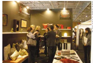
メゾン・エ・オブジェ2007

問い合わせ(事務局) / 京都商工会議所 産業振興部 〒604-0862 京都市中京区烏丸通奥川上ル 075-212-6451 075-255-0428 http://www.kyo.or.jp/premium/ E-mail: premium@kyo.or.jp