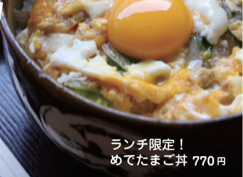
ランチ限定! めでたまご丼 770円