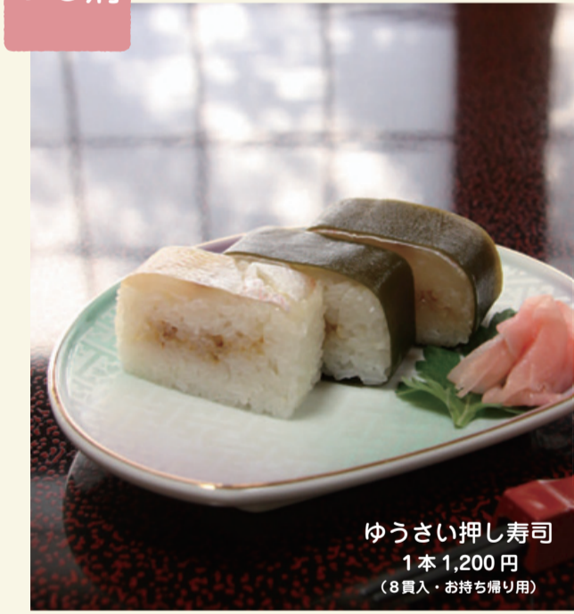
うはさい押し寿司 1本 1,200円 (8貫入・お持ち帰り用)

ゆるりと・特典 店内でお食事の方に「チラシ見たよ!」で (3月末まで) コーヒー1杯サービス