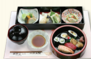
和室のテーブル席で、ゆったりランチもいただける。写真上の『ひだまり膳』は天ぷら、焼き合せ、小鉢物、お寿司6貫、吸物で1260円。1日4組限定(要予約)