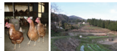
写真左から) 万願寺甘とうや自家産など飼料にもこだわった『めでたまご』/平飼で大切に育てられる鶏/自然豊かな赤岩山のふもと、西方寺平

新商品の開発にあたっては、地産地消に関心の高い店主達が西方寺平の生産農家を訪問し、お話を伺いました。同じ舞鶴でもまったく違う豊かな自然と景色に一同びっくり! この恵まれた環境で大切に育てられる素材を使うことに、あらためて喜びや誇りを感じたのでした。