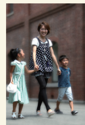
ゆるりと・特典 先着30名様 カジュアルフォトご成約の方に 写真入りキーホルダープレゼント

もっと自然な家族写真を残したい! という方におすすめなのが、この『カジュアルフォト』。スタジオを飛び出して、ご希望のロケ地でプロカメラマンに撮影してもらえます。きっと思い出に残る“素敵なお写真”になること間違いなし! 【スタジオメイト キョワードー】 ☎0773-62-0369 火曜定休 舞鶴市字浜 421-2 9:30~19:30 http://www7.pala.or.jp/studio-mate/