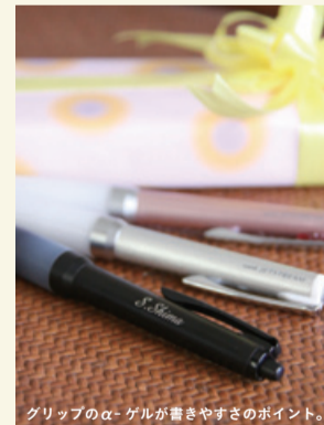
志摩至誠堂セレクト お名前入りボールペン 1260円 【セット内容】uni JET STREAM(ジェットストリーム) SNH-1000 シリズメーター希望本体価格 1050円+替芯105円+レーザー名入れ315円=合計1470円(税別)※本体カラーはブラック、シルバー、ピンクの3色※詳細はお問い合わせ下さい