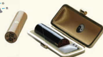
隠れ身の印 (左) 龍摩本つけ 13,000円 (右) 黒水牛 26,000円 ※ケースは別売

【神谷印判店】 ☎0773-62-0904 日・祝定休 舞鶴市字浜 217 9:00~19:00 通信販売『はんこオンライン』 http://www.hanko-online.com/