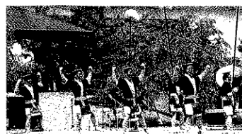
まいづる 舞鶴公園内にて披露

当所青年部が制作した幽齋公のイメージキャラクター「ゆうさいくん」も参加し、まつりを盛り上げるとともに、NHK大河ドラマ誘致促進に積極的に取り組みました。