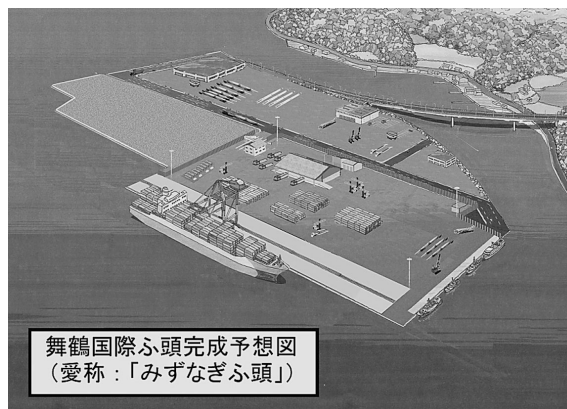
舞鶴国際ふ頭完成予想図 (愛称：「みずなぎふ頭」)

今後、このような立地企業が事業展開されることで、京都舞鶴港の活性化、京都府北部の産業振興につながることを大いに期待しているところです。