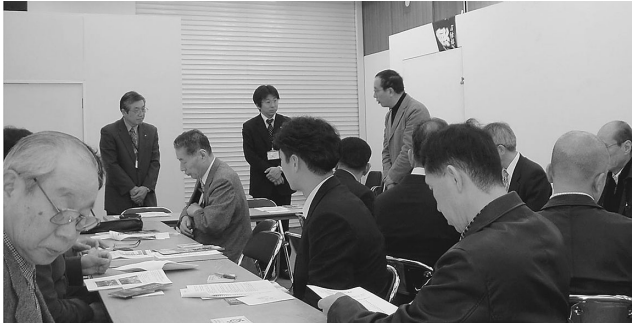
商業部会が姫路まちづくりステーションを視察。熱い議論が交わされた。