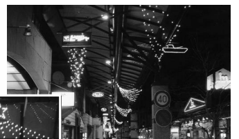
▲三条商店街を照らす船のイルミネーション

駅から海へと続く商店街に、船と波、星のイルミネーションがロマンチックに光る通りとなりました。