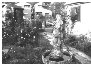
店主がプランニング、デザイン、施工したガーデン (店舗前)

また、舞鶴市まちづくりデザイン賞を3年連続受賞し、美しく暮らしやすさを大切にしたいデザイン性の高い施工が高く評価されています。