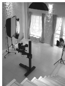
白を基調とした明るいメインスタジオ

「来ていただいたお客様に、よい写真をお渡しするとともに、写真館で写真を撮ることを楽しんでいただけるよう、常に努力しています」と熱い思いを語られました。