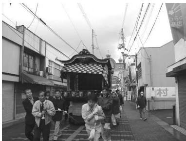
展示会場へ向かう丹波芸屋台

昨年11月23日～25日西地区一帯で開催された大ぶす市において、舞鶴TMOは、寺内と丹波の「芸屋台」の展示を西市民プラザふれあい広場で行い、多数の方々に見ていただくことが出来ました。