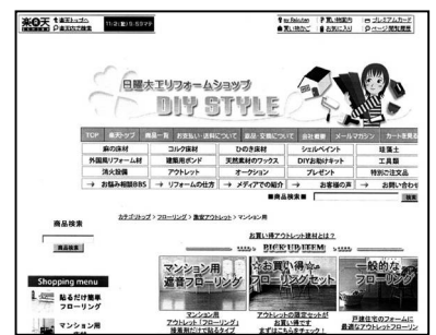
取り扱い商品を紹介するホームページ