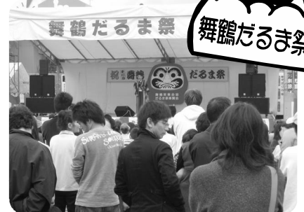
11月2日~4日、東地区商店街周辺で開催。今年は60回記念。恒例の北海道物産展など、イベントが目白押しで大賑わい。写真は舞鶴実業会広場での歌謡ショー。(主催:舞鶴実業会事業(協)、だるま祭奉賛会)