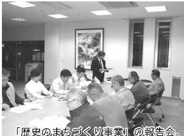
「歴史のまちづくり事業」の報告会。市民の皆様からは、具体策の提示が求められました。

舞鶴TMOは昨年12月に、市民とともに進める中心市街地活性化事業「歴史のまちづくり事業」と「浜団地・八島公園周辺整備検討事業」の提案書を、舞鶴市長に提出しました。その後、舞鶴市で提案書の内容を検討した結果、方針案がまとまったので、11月5日「歴史のまちづくり事業」・11月8日「浜団地・八島公園周辺整備検討事業」のメンバーにお集まりいただき、報告会を開催しました。