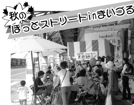
10月7日、東地区商店街周辺で開催。各商店街のイベントも大盛況。写真は三条商店街の海鮮鍋コーナー。(共催:(協)東舞鶴商店街連盟、舞鶴実業会事業(協)、舞鶴市)