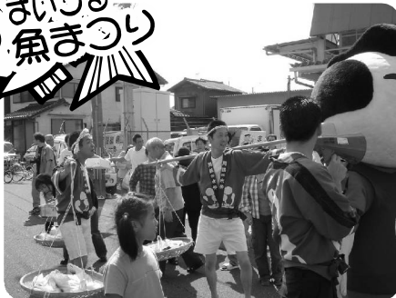
10月7日、舞鶴水産流通センター周辺で開催。一心太助に扮した魚売りも登場。新鮮な魚が安い値段でとびうのように売れた。(主催:舞鶴水産流通協同組合)