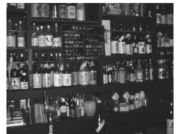
店内には200種類以上の焼酎が並ぶ