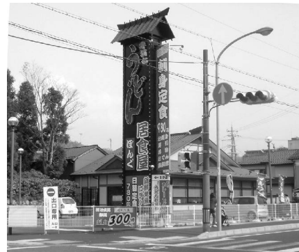
国道27号線からの店舗外観