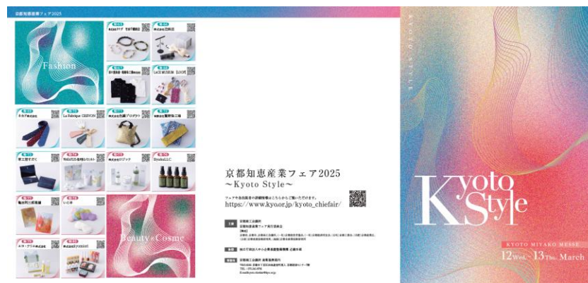
前回リーフレット