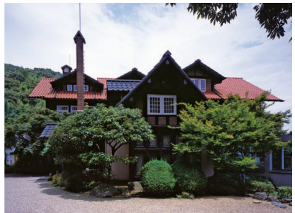
アサヒビール大山崎山荘美術館