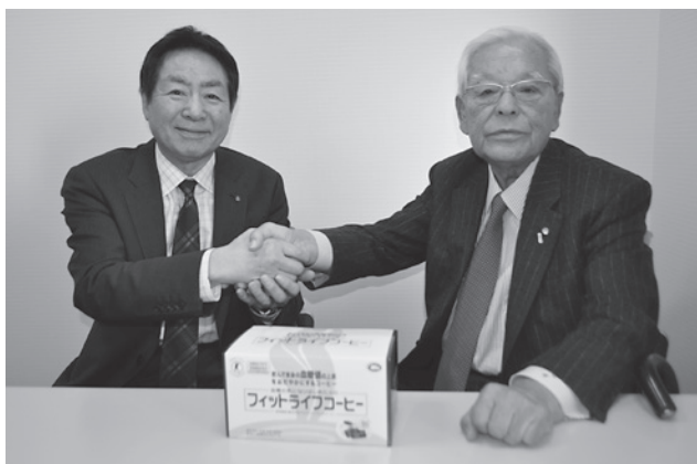
左から簀社長、平井部会長

株式会社ミル総本社は、昭和52年の創業で、30年にわたり本所にご入会いただいています。同社の主力商品は特定保健用食品「フィットライフコーヒー」。特定保健用食品制度の認定には多額の開発費用と長い期間がかかることから、中小企業ではなかなか認定されなかったところ、平成12年に同社は全国で初めてコーヒーで消費者庁の認定許可を得られました。この商品は、コーヒーのおいしさそのままに豊富な食物繊維(難消化性デキストリン)を摂取でき、食事に含まれる糖の吸収を