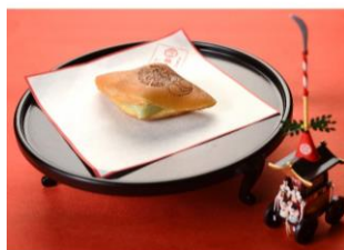
鶴屋長正「山鉾巡行餅」5個入 税込1,182円