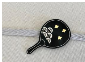
中嶋象嵌「うちわ型帯留め 千鳥」税込13,200円