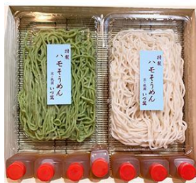
祇園かまぼこ いづ萬「ハモそうめん詰め合わせ」税込2,527円