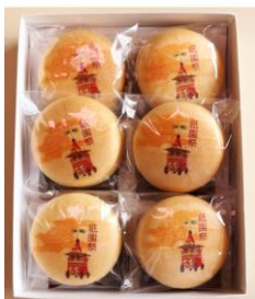
高野屋貞広「創作最中 おつくりやす」6個入 税込1,188円