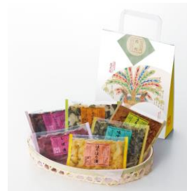
西利「味の小さ袋・祇園祭」6袋入 税込1,080円