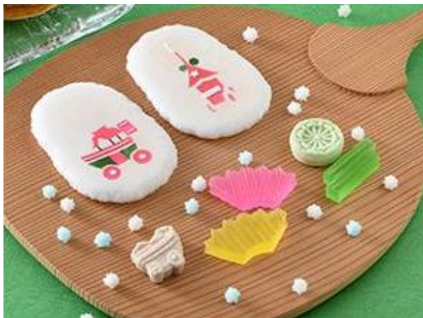
俵屋吉富 創作干菓子「祇園囃子」 (煎餅4枚、落雁2個、琥珀糖3個、金平糖20g) 税込972円