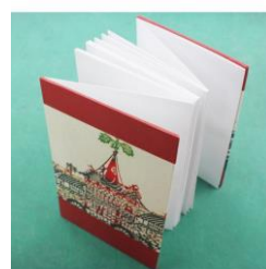
表現社「御朱印帳 京の風景1」税込1,650円