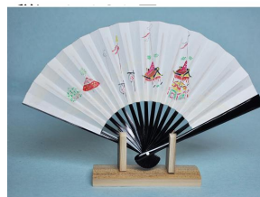
とくの「手書き茶席扇子 祇園祭」税込3,630円