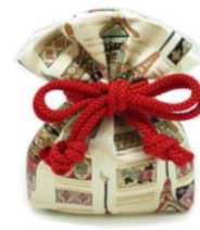
山田松香木店「祇園祭 御所袋 紙箱入」税込4,950円

この他に、フランス屋製菓「京洋菓子司 ジュヴァンセル 祇園祭フィナンシェ」、本家西尾八ッ橋「あんなま 夏の三色」、野村佃煮「祇園祭 ちりめん山椒」、京都洛齊「西陣織テーブルセンター 三大祭」、みつる工芸「麻の日傘 水玉」などを出品しています。