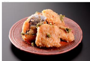
くらま辻井「はも茶漬け」70g入 税込1,080円