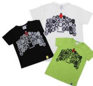
青野「キテキテ コンチキチンTシャツ」税込4,290円～5,830円