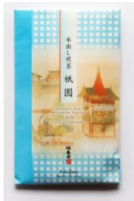
福寿園「水だし煎茶 祇園祭」50g袋入 税込1,080円