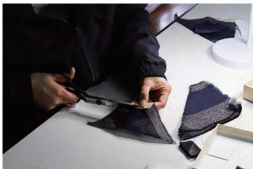
③残布を向きを揃えて手作業でカットします。