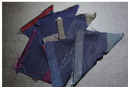
②裁断の際、端の部分が余ります（残布）。