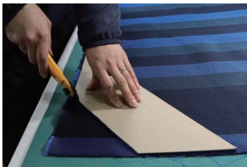
①生地を裁断し製品のネクタイを縫製をします。