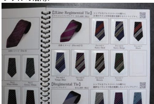
QRコードをスマホカメラで読み込めば購入ページを表示します。