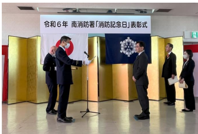
2024年3月3日（日）令和6年 南消防署「消防記念日」表彰式にて撮影