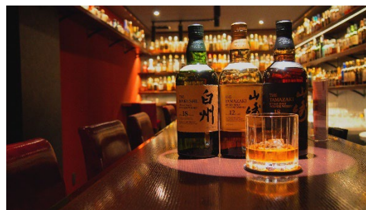
お酒の美術館 イメージ