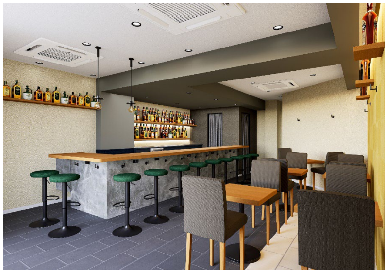
お酒の美術館 富小路店 店内イメージ