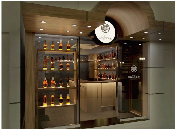
お酒の美術館 四条大宮店 店外イメージ