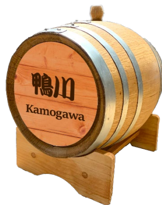
オリジナル樽ブレンド「鴨川」

お酒の美術館がオリジナルでブレンドした樽ウイスキー「鴨川」(500円)は、樽香る、調和の取れた柔らかな味わいが特徴のハイボールに合うオリジナルのブレンドウイスキーです。ぜひお試しください。