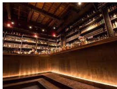
お酒の美術館 三条烏丸本店

通常路面店舗に加えて、コンビニ、スーパー、駅、空港など様々な業態でコラボ出店することで、より多くの方がバーを身近に感じられる「気軽に飲めるバー」を展開し、 2030年までに全国1,000店舗の出店 を目指しております。