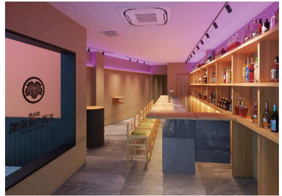
お酒の美術館 四条先斗町店 店内イメージ