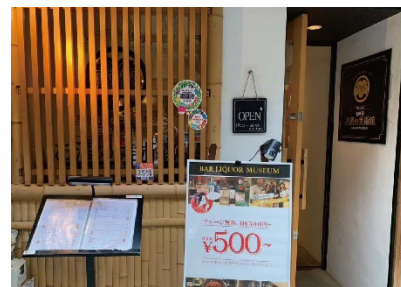
お酒の美術館 先斗町店

是非、貴社媒体でお取り扱い頂きますようお願い申し上げます。ご不明点などございましたら、お気軽にお問い合わせください。