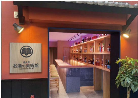
お酒の美術館 四条先斗町店 店頭イメージ