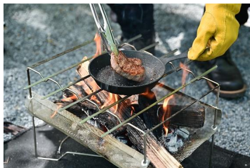
MULTI SOLO Bonfire Stand