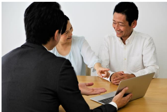
■ パーソナル相続勉強会イメージ