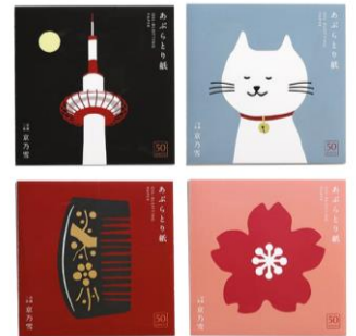
京都二条 京乃雪「あぶらとり紙」 (50枚×4冊) 1,540円