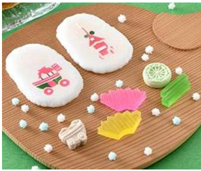
依屋吉富 創作干菓子「祇園囃子」 (煎餅4枚、落雁2個、琥珀糖3個、 金平糖20g) 1,080円