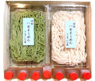
祇園かまぼこ いづ萬 ハモそうめん詰め合わせ 2,527円