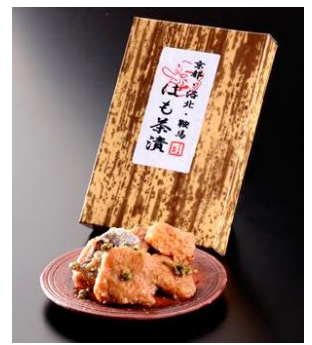
くらま辻井「はも茶漬」 (70g) 1,080円