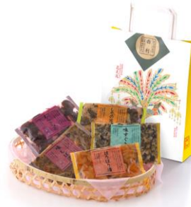
西利「味の小さ袋・祇園祭」 (5袋入) 1,080円