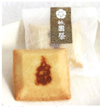
京洋菓子ジジュヴァンセル 「祇園祭フィナンシェ」(8個入) 2,204円