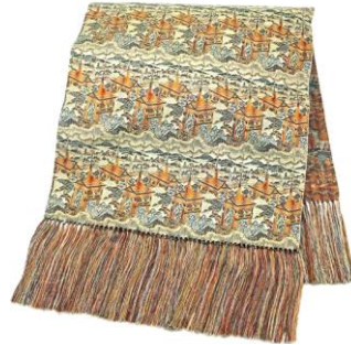
瀬川織物「西陣織経錦織テーブル センター」(ページュ) 5,280円