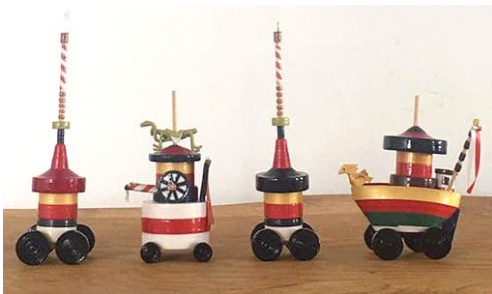
雀休「京こま 祇園山鉾」(左から) 長刀鉾 3,630円、蟹螂山 5,500円、 月鉾 3,630円、船鉾 5,500円