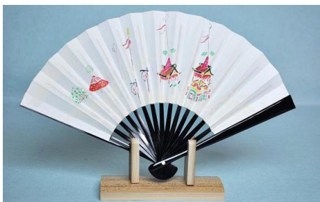
とくの「手描き茶席扇子 祇園祭」 3,850円