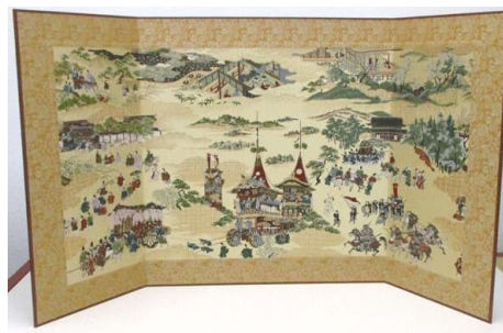
京都洛齊「オリジナル西陣織屏風 (三大祭り) 14,300円