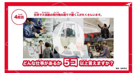
スライド(イメージ)

「JALの謎解き×チームビルディング」は、全国の小学生対象として、航空会社の仕事をテーマにしたナゾ解きを通して「チームワーク」について学ぶことができる教材です。現役教員の声をヒアリングし、教材は学校の先生が使いやすい形式を追求しました。授業スライド・ワークシート・指導案・授業台本のすべてを公式サイトから無償ダウンロードいただけます。学校の授業など、さまざまな教育現場でお使いいただけます。