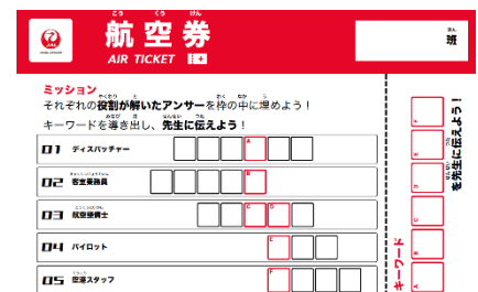
ワークシート(イメージ)

W-PITと80&Companyは、「子どもたちが社会について触れる機会が少ないこと」や「都市部と地方での地域による教育格差」、「良質な教材が手にはいりにくいこと」などさまざまな課題解決に取り組むことで、今後も次世代の人材育成に取り組んでいきます。