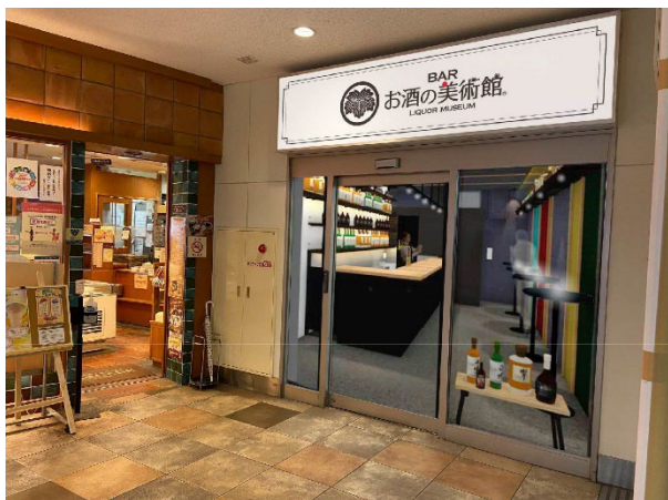
店舗イメージ 京阪丹波橋駅 直結！