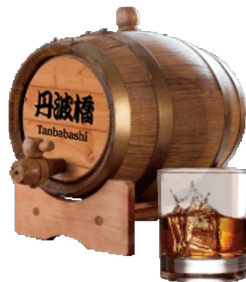
オリジナルブレンド樽

また、「スモーキーブレンド」(700円)は、ラフロイグベースでガツンとしながらも奥深さを出しました。上品でスモーキー。ぜひお試しください。