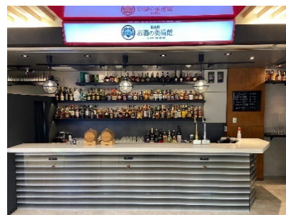
お酒の美術館 近鉄難波駅店

通常の店舗に加えて、コンビニ、駅等々、気軽に飲めるバーを様々な業態及び出展場所に展開 2030年までに全国1,000店舗 の展開を目指しております。