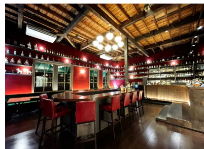
お酒の美術館 三条烏丸本店

是非、貴社媒体でお取扱い頂きますようお願い申し上げます。ご不明点などございましたら、お気軽にお問い合わせください。