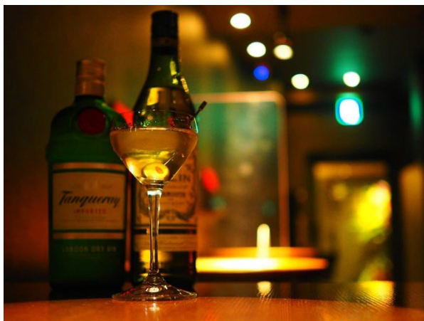
チャージ無料で気軽にご利用いただけます