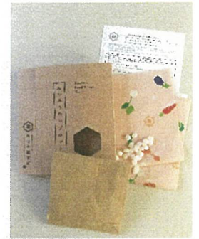
みつろうラップキット