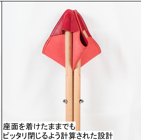
座面を着けたままでも ピッタリ閉じるよう計算された設計