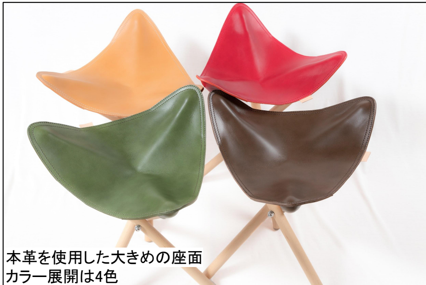
本革を使用した大きめの座面 カラー展開は4色