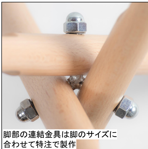
脚部の連結金具は脚のサイズに 合わせて特注で製作