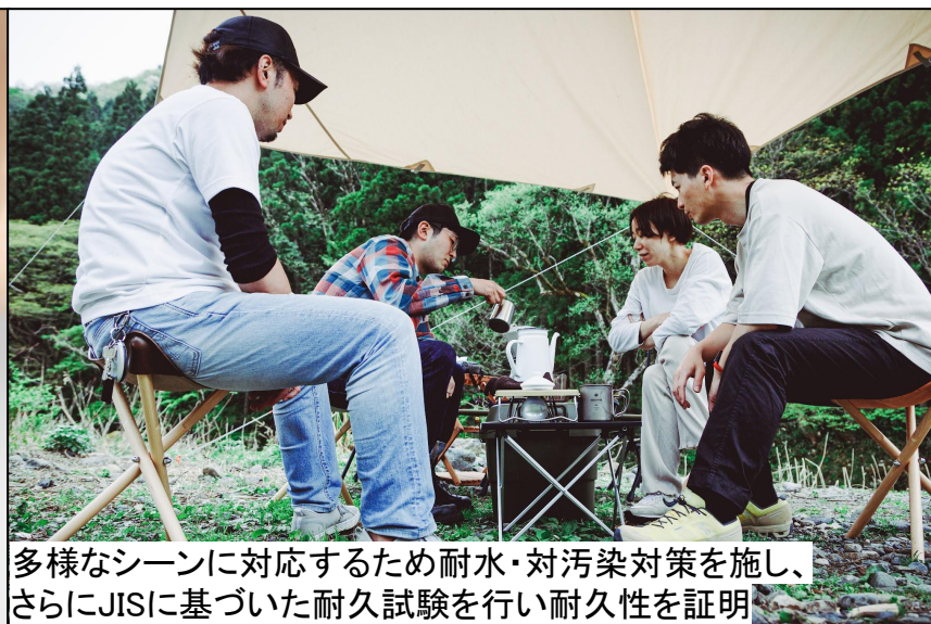
多様なシーンに対応するため耐水・対汚染対策を施し、 さらにJISに基づいた耐久試験を行い耐久性を証明

座面を着けたままでも折りたたみが可能なので、 コンパクトに持ち運びができ、様々なシーンで活躍！