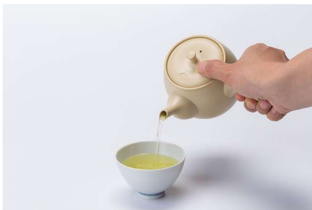
煎茶イメージ画像

創業 1717 年、300 年余り続く「一保堂茶舗」の煎茶『薫風』と、急須や汲み椀、茶托などの茶器一式、お茶菓子を客室にご用意。お客様ご自身の手でお茶を淹れることにより、心を穏やかに静め、ゆったりと寛ぎながらお茶そのものの香りや味わいを楽しんでいただくプランです。客室には「一保堂茶舗」を紹介する映像を見ることができのご案内用紙や、淹れ方によって風味が変わる煎茶の楽しみ方を学ぶことができるレシピを設置いたします。