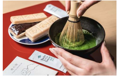
「お部屋で気軽にお抹茶体験プラン」イメージ画像