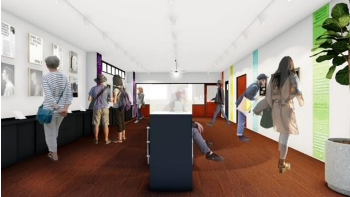
レースミュージアム【LOOP】 CGイメージ