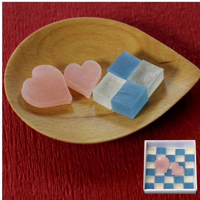
ラムネユズコハク