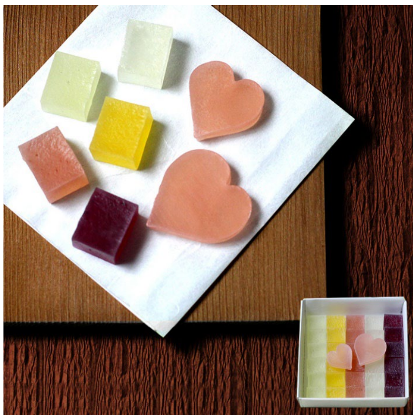
フルーツ琥珀「果乃菓」