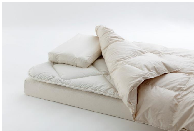
自然が育んだ素材を活かしました