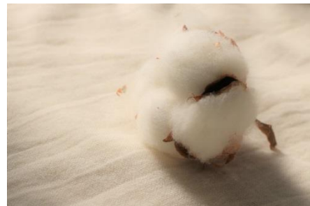
無漂白・無染色の素材だけで作った寝具

日本では古来より、人と自然との調和が重んじられてきました。健やかに命を紡いでいく知恵として、水や空気、動植物がもたらす資源を大切に使ってきたのです。今、私たちは再び原点に立ち戻り、ものづくりを見直したいと考えています。現実の壁は阻まれて実現に至っていない構想もあります。サステナビリティへの取り組みは終わりのない旅路。unbleachedという新たな一歩を、次の行動につなげています。