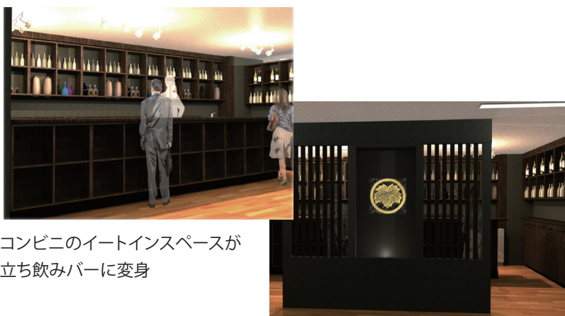
コンビニのイートインスペースが 立ち飲みバーに変身

今後「お酒の美術館」は、博多駅前店を皮切りに3年間で100店舗の計画で全国に展開していく予定です。