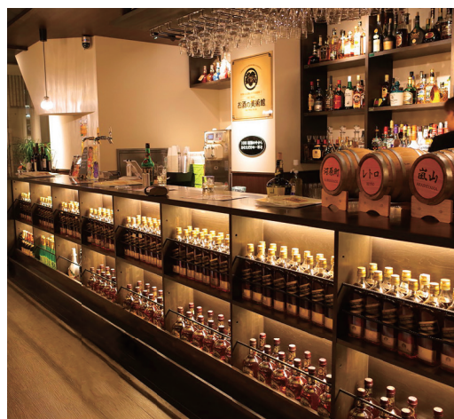
日本をはじめ世界のお酒を多数取り揃え