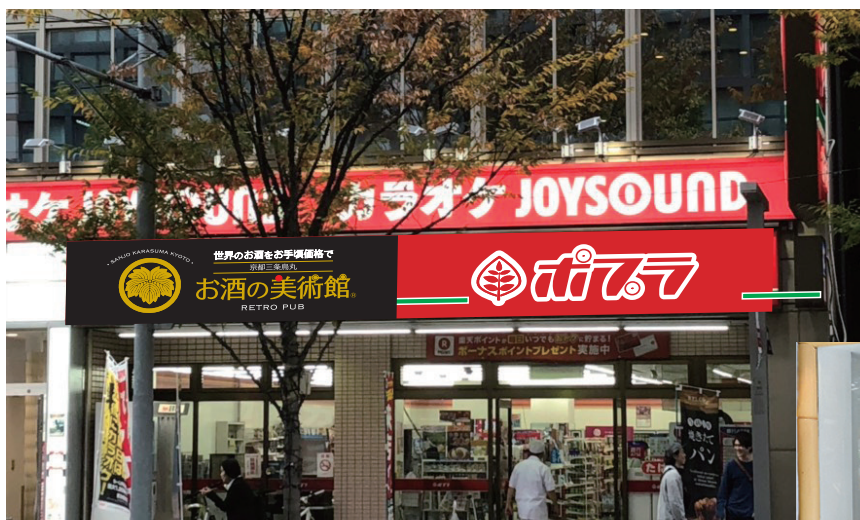
写真は完成イメージです