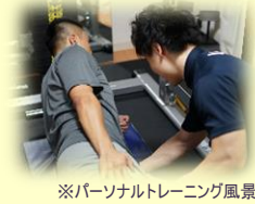
※パーソナルトレーニング風景