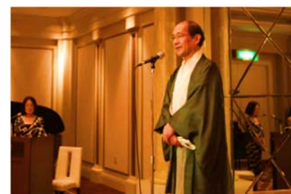
交流会には門川市長もお越し下さいました。