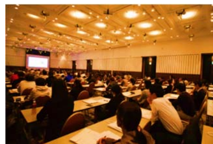
昨年のカンファレンスの様子