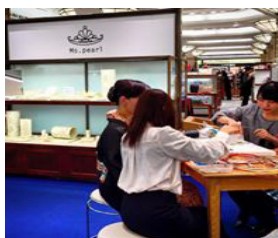
日本橋三越出店 (期間限定)