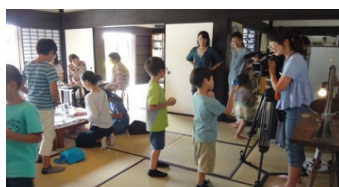
熊本チャリティーワークショップ