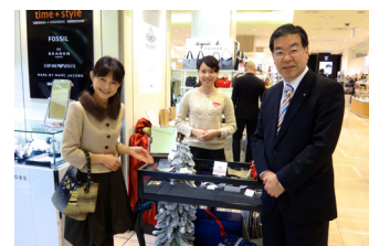
京都高島屋に府知事夫妻もご来店いただきました