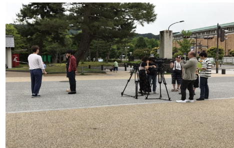
コンセプトムービー撮影