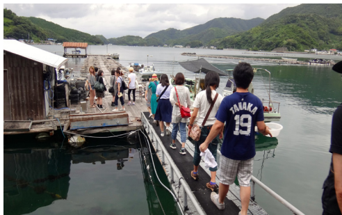
宇和島スタディーツアー