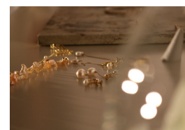
春の新作コレクション