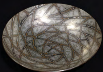
佐故能平 「柰目金小皿」 2016 オーディエンス賞