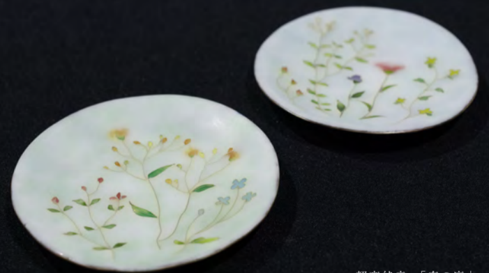
頼高純音 「春の庭」 2016 月桂冠賞