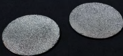
野口嶺 「雫」 2016 Mention spéciale Institut français du Japon